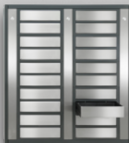
Anexo Cajas de seguridad

Tamaños: 10, 20, 40, 80, 120, 180, 240, 280, 360 llaves en un mismo armario y armarios de extensión.